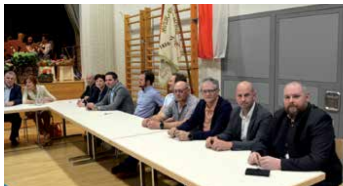
Dank an die Gemeindevertretung.