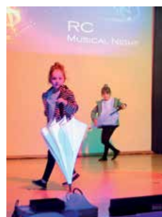
Radlerball mit RC Musical Night.