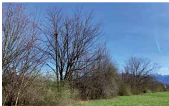
Hecken als Lebensraum für Pflanzen und Tiere.

angelegt wurden, erfreuen nicht nur das Auge, sondern bieten mit ihrer Artenvielfalt wichtige Lebensbereiche für zahlreiche Kleintiere und Insekten.