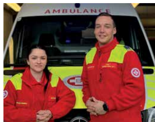
Praktikum beim Rettungsdienst.