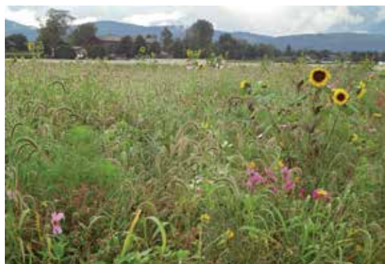
Einsatz für schonenden Umgang mit der Natur.