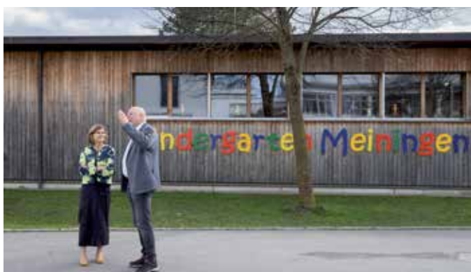
Angelangt beim Bildungscampus Meiningen.