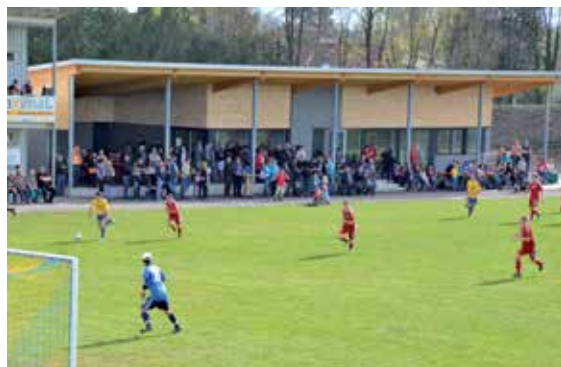
SKM Klubheim.