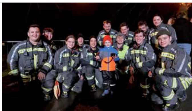
Brandwache beim Funken.