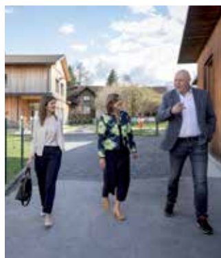
Am Bildungscampus unterwegs.