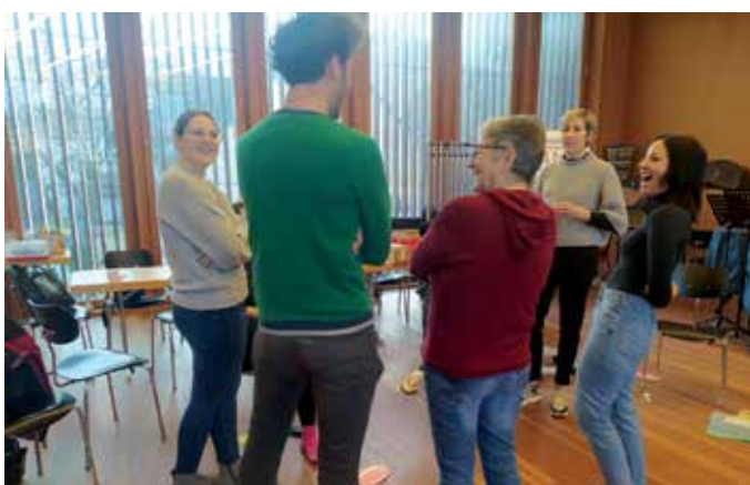
Klausurtag für das Team des Zwergengartens.

„Es war ein interessanter und entwicklungsreicher Tag sowie ein Mehrwert für alle“, sind sich die Pädagog:innen einig.