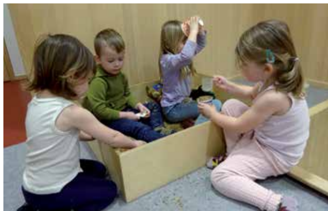
Kunterbunte Farbenwochen im Zwergengarten.