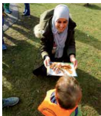
Funken im Kindergarten mit der Funkenzunft und Funkenwaffeln.