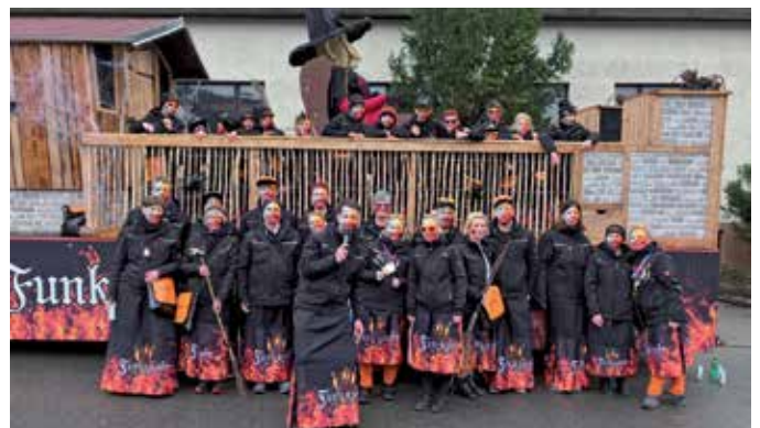
Der neue Wagen 2024.