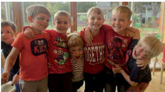
„Rottag“ und „Blautag“ im Kindergarten.