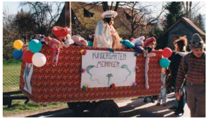
Wagen 1995 für den Kindergarten.