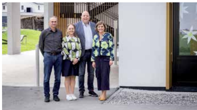
Die Landesstatthalterin zeigte sich vom Bildungscampus Meiningen beeindruckt.