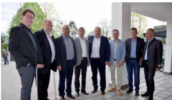
Einige Bürgermeisterkollegen der Regio Vorderland.

sondern immer auch mit „großem Respekt und Anstand“ geleitet habe. Pinter habe einen festen Grundstein gelegt, betonte Fleisch, auf dem er nun aufbauen könne.