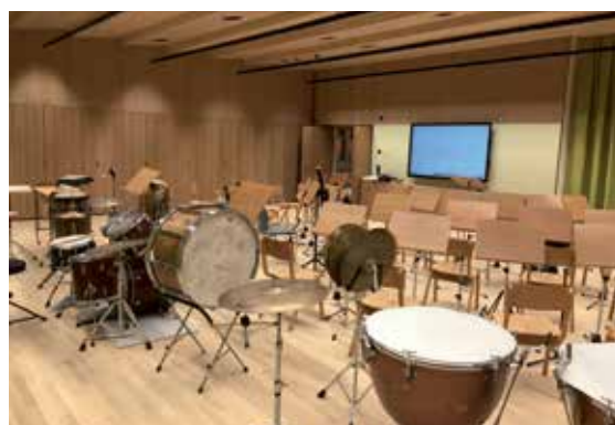
Musik Probelokal.