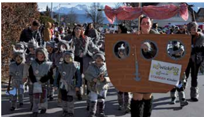
Faschingsumzug 2024: Wicki und die STARKEN Kinder.