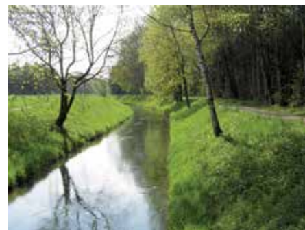
Wegesicherheit, saubere Wiesen und ordentliche Wege, Bachdamm ausmähen - das ist nur ein Bruchteil der Aufgaben für den Bauhof.