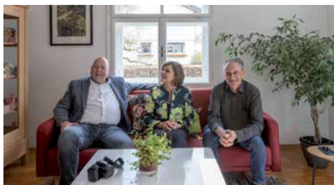
Gemütliche Plauderei in der Bibliothek.