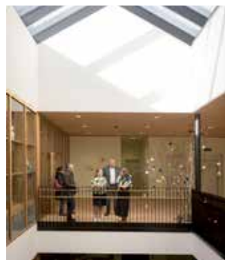
Im österlich geschmückten Schulgebäude.