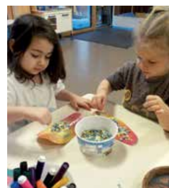
Bunte Faschingsspiele im Zwergengarten.