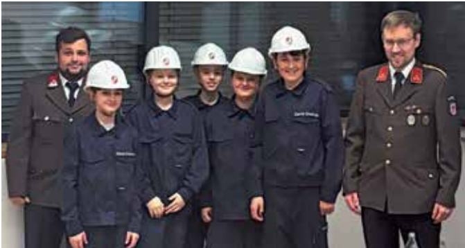
Überreichung des Jugendhelms als Zeichen der offiziellen Aufnahme.