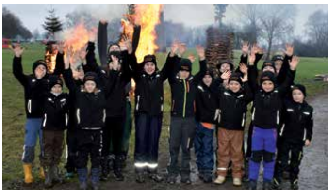
Der Funkenzunft-Nachwuchs übte Funken bauen...