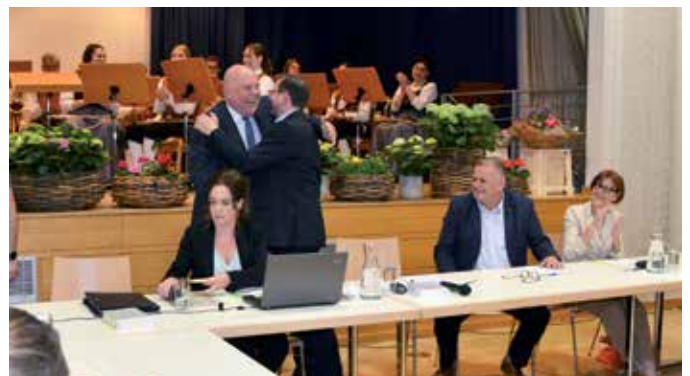
Gratulation zur Wahl.