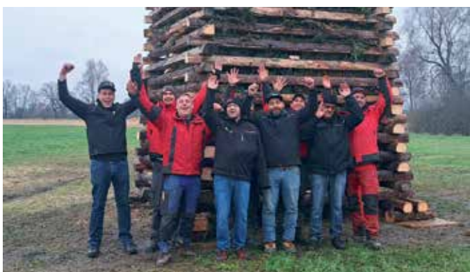
...die Großen sind schon Profis. | Fotos: S. Strießnig