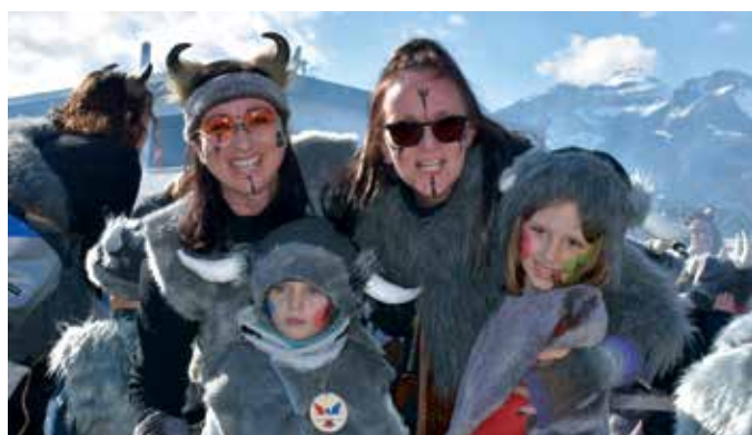
Wicki und die STARKEN Kinder beim Faschingsumzug.