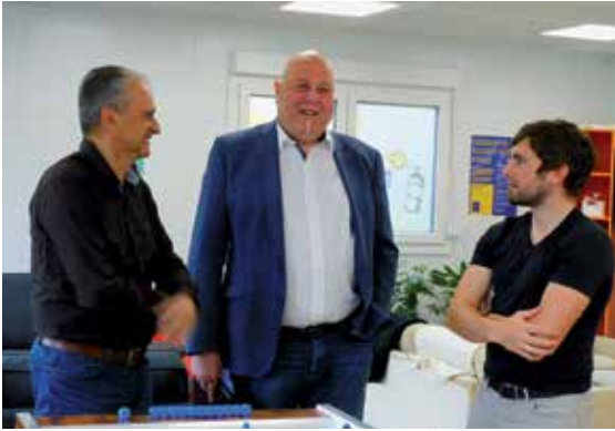
Im neuen „Point“.