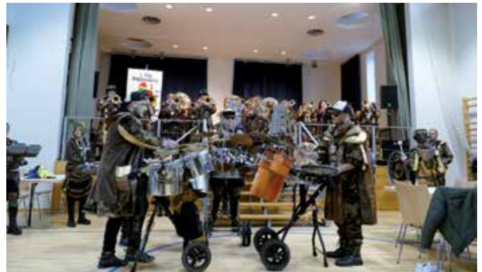
Faschingsauftritt am 11.11.2023