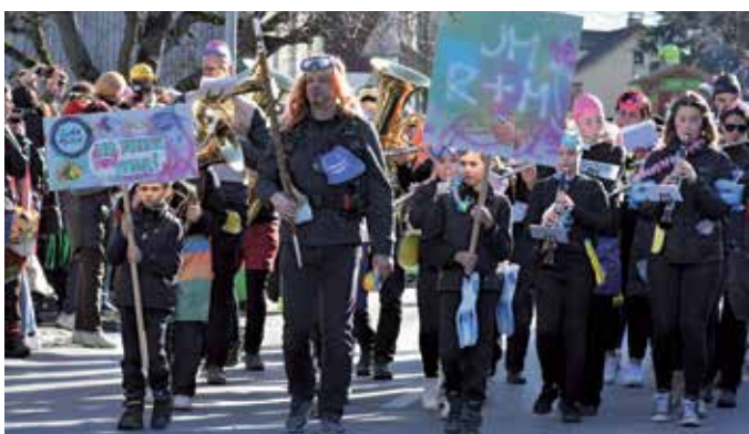
Die Jungmusik in Aktion.