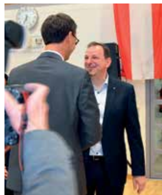
Der Landeshauptmann gratuliert.